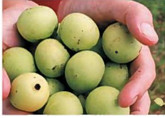
▲厳しい自然環境で生き抜くために、固い皮で包まれたマルラの実。甘酸っぱく、栄養豊富なので野生の象も好んで食べるそう。