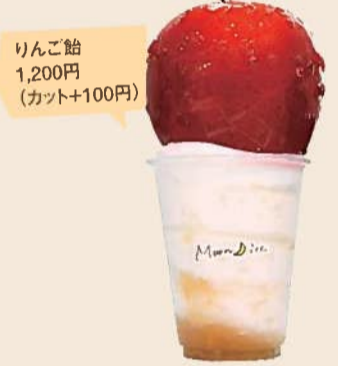
りんご飴 1,200円 (カット+100円)

「夜アイス」専門店「Moon ice」に、大きなりんご飴が乗ったインパクト抜群のアイスが登場! フルーツ飴専門店「Fresh Candy」が手掛けるりんご飴は、ほどよい甘さ&バリバリ&ジューシーでやみつきになる美味しさ。アイスには果肉感たっぷりのりんごソース入りりんご飴は店頭でカットもOK。アイスにディップして楽しもう♪