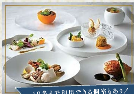
10名まで利用できる個室もあり！

かつて聖堂として使われた場所を改修したレストラン。高さ約10mのアーチ型天井や、当時のデザインを再現したステンドグラスに囲まれる空間はまるで異国のよう。ビュッフェスタイルの朝食を提供するほか、ランチ・ディナータイムは宿泊ゲスト以外も楽しむことができる。長崎の伝統と新しさを感じるコースや、こだわりの長崎南蛮黒カレー、スペシャルバーガーなどアラカルトも豊富。