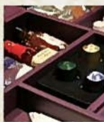
全客室に完備のミニバー