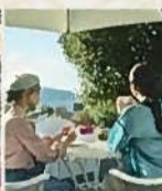
港の風景を楽しめる中庭