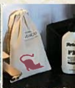
持ち帰りOKなアメニティバッグ