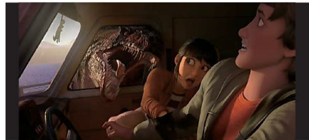
Netflix映画 『ジュラシック・ワールド/サバイバル・ミッション』