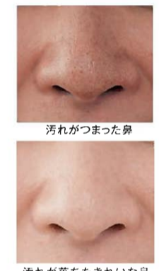
汚れがつまった鼻