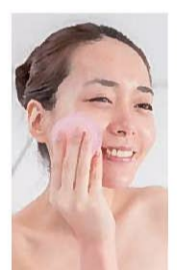
やわらかいこんにやく石鹸をお肌へ直接滑らすと、洗顔とは思えない気持ち良さ。

小鼻の周りや目元のくまにももしっかりフィットして洗いやすく、泡立てる手間がいらないから、とても楽ちん。洗顔後、潤いもしっかり残っていて肌がつっぱらない。しかもずっと悩んでいた毛穴のポツポツや小鼻周りのサラサラもツルツル!