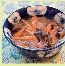
はるさめと人参 黒木耳のスープ